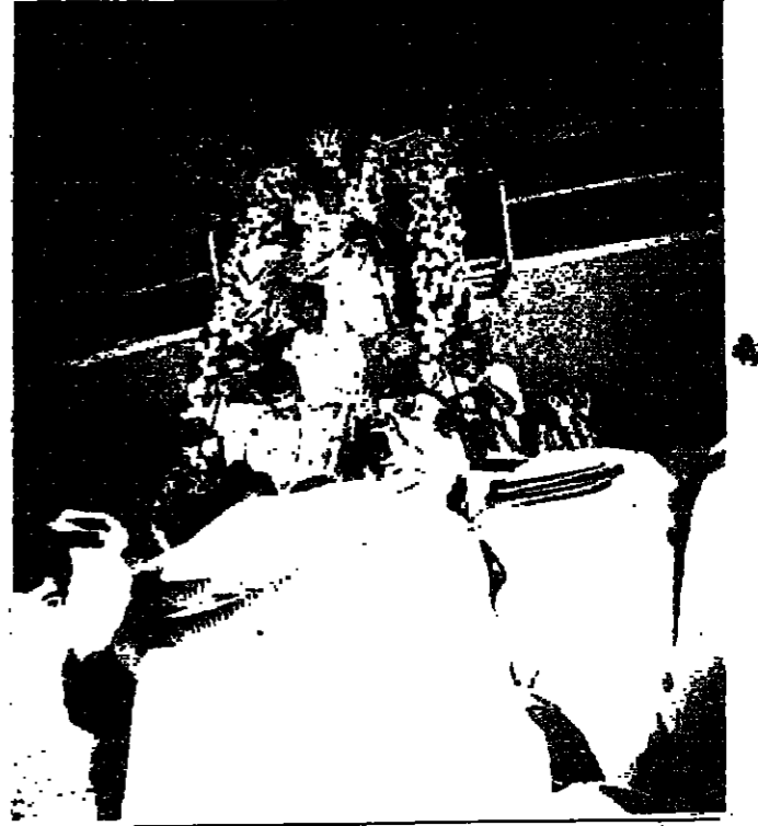
عليان والبحلة : بعث صاحب السمو الملكي الأمير محمد بن سعود بن عبدالعزيز أمير منطقة الباحة ببرقية تهنئة إلى صاحب السمو الملكي الأمير فيصل بن فهد بن عبدالعزيز الرئيس العام لرعاية الشباب هناك فيها بحصول منتخبنا للناشئين على بطولة كأس العالم وأشاد سموه بالتخطيط السليم والذي كان وراء احراز هذا الحدث الكبير.